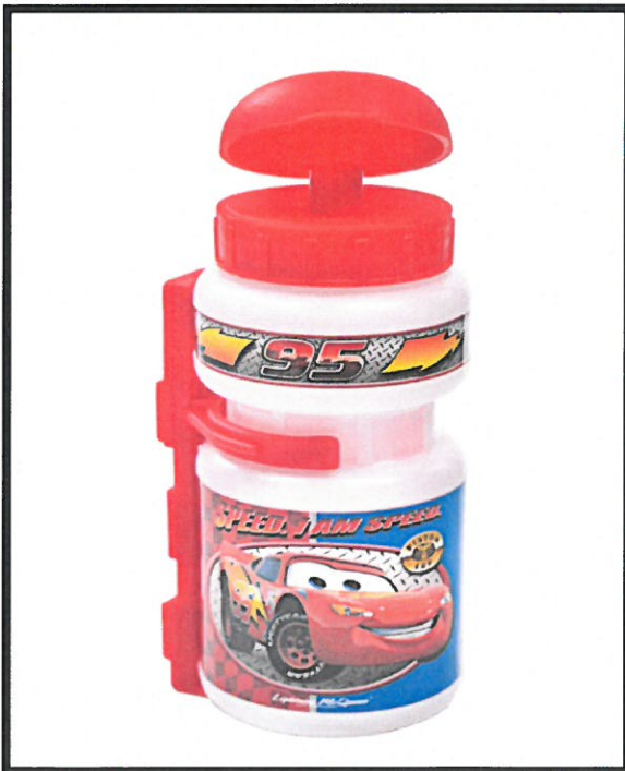
Foto : (CARS), gælder også Barbie, Mickey, PetShop, Princess, Handy Manny, Peter Plys, Tigerdyr, Playmobil, Toy Story.

SØNDERGAARD & SØNNER A/S FABRIKVEJ 3 - DK-8260 VIBY J.